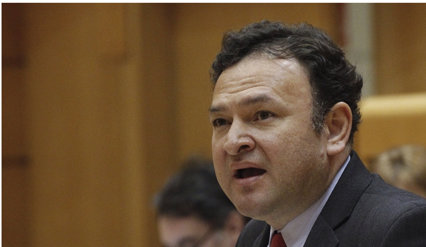
El senador del PSOE por Jaén, Pío Zelaya

MADRID / El senador del PSOE por Jaén, Pío Zelaya, pedirá al Gobierno, la próxima semana en la Cámara Alta, que impulse al máximo las actividades conmemorativas del 75 aniversario de la muerte del poeta Miguel Hernández y participar en cuantas iniciativas se organicen para promover el estudio y la difusión de su vida y su obra. Zelaya reclamará también al Ejecutivo que coopere, proporcionando tanto apoyo institucional como económico, con las administraciones y/o entidades que han programado actividades para la celebración del aniversario. Por último, solicitará que se establezca la consideración de acontecimiento de excepcional interés público para dicho aniversario, a los efectos de aplicar beneficios fiscales de acuerdo con lo dispuesto en el artículo 27 de la Ley 49/2002, de 23 de diciembre, de régimen fiscal de... LEER MÁS ►