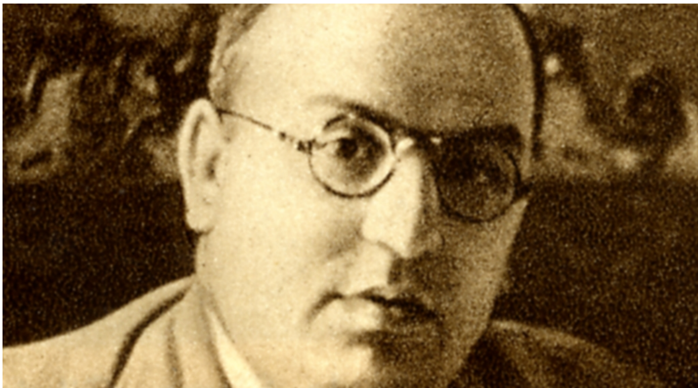
Rafael Henche de la Plata / Fundación Pablo Iglesias