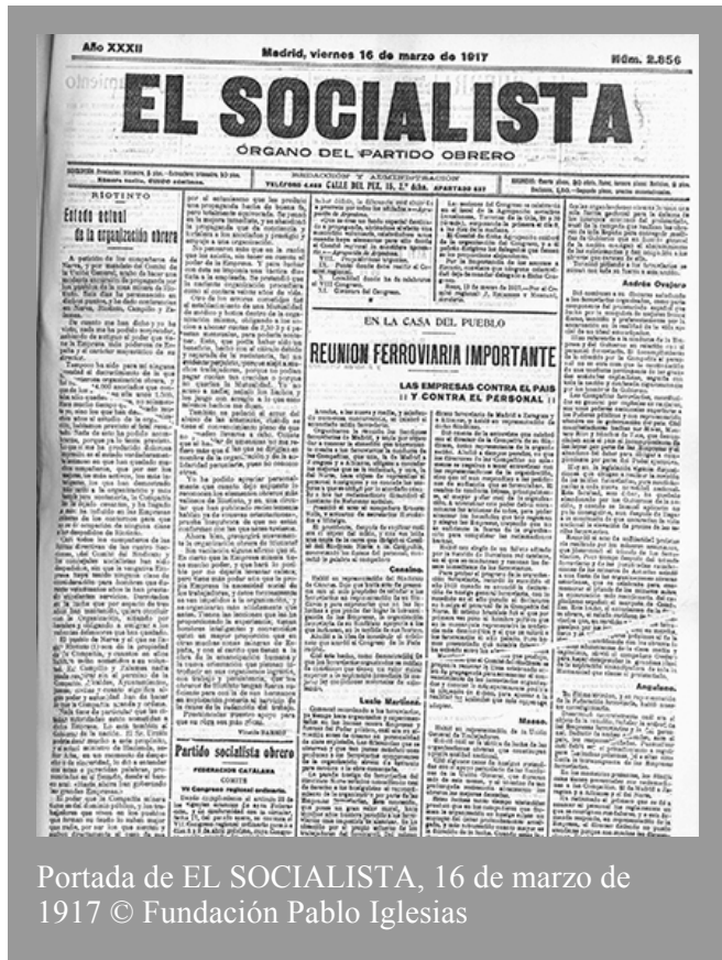
Portada de EL SOCIALISTA, 16 de marzo de 1917